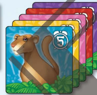
5x 母獅 5小時