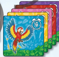
5x 鸚鵡 4小時