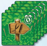
5x 告示牌 0小時