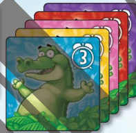
5x 鱷魚 3小時