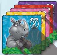
5x 犀牛 2小時