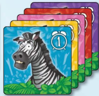
5x 斑馬 1小時